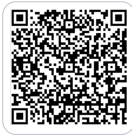
京东安联成长优享-疫苗福利