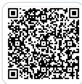
京东安联成长优享PLUS-疫苗福利

请在就诊前务必查询就诊私立医院是否在网络医院列表内 如有任何疑问致电： 021-80209058 (7*24小时)